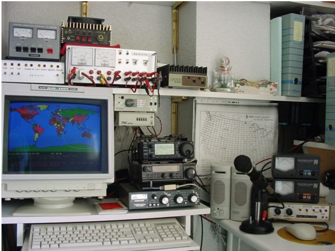
Estación de radio sencilla para trabajar satélites (de EA4CYQ)

El sistema que propongo es polivalente pues en VHF y UHF nos va a permitir no solo trabajar satélites, sino comunicaciones terrestres vía directa en banda lateral y FM (repetidores) con brillantez y participar en experiencias como escuchar rebote lunar, perseidas, etc.