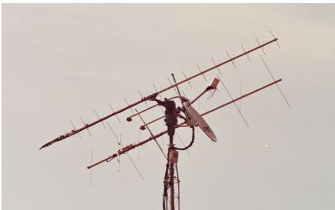
Vista lateral de sistema radiante de una estación de satélites típica

Con todo lo que ya sabemos, casi intuimos nuestras necesidades. Para trabajar los satélites LEO de FM ya sean de fonía, como digitales solo hace falta un equipo de VHF y UHF Full-Duplex y 25 W en cada banda. En el caso de los digitales, la TNC correspondiente. El equipo que lo tiene todo, incluso la TNC es la TM-D700, aunque las mayoría de los móviles bibanda cumplen con los requisitos. Siempre se pueden utilizar dos equipos monobanda.